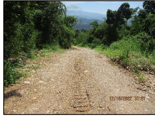
ภาพที่ 2.5 สภาพเส้นทางคมนาคมภายในพื้นที่โครงการ