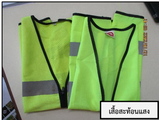
เสื้อสะท้อนแสง