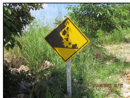
ภาพที่ 2.4 ป้ายจราจร และป้ายเตือนอันตรายภายในพื้นที่โครงการ