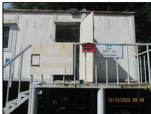
ภาพที่ 2.8 ตู้รับเรื่องร้องเรียนบริเวณหน้าเหมือง