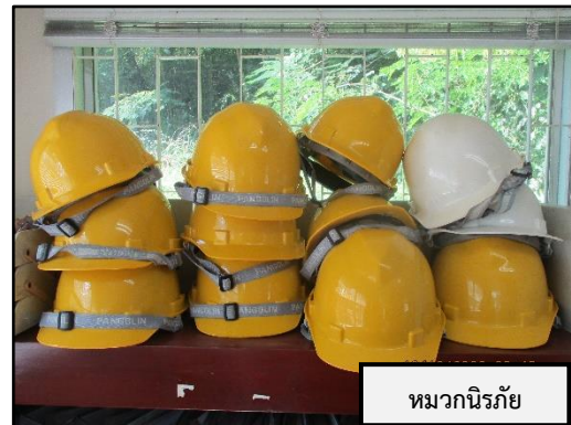
หมวกนิรภัย