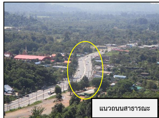
ภาพที่ 2.3 การเว้นระยะพื้นที่ไม่ทำเหมืองเข้าใกล้แนวถนนสาธารณะ