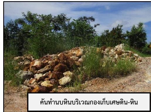
ภาพที่ 2.2 พื้นที่กองเก็บเศษดิน เศษหิน