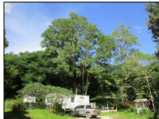
ภาพที่ 2.7 การปลูกต้นไม้โดยรอบพื้นที่โครงการ