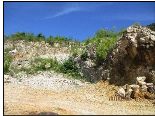
ภาพที่ 2.1 พื้นที่หน้าเหมืองในปัจจุบัน