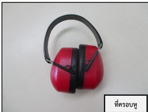
ที่ครอบหู